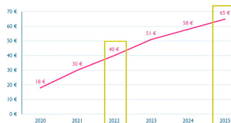
Évolution de la TGAP entre 2020 et 2025

Sans une réduction des OMR, le surcoût serait de plus d'1 million d'€ et impliquerait de fortes hausses de la Redevance. Aujourd'hui, le SIMER maintient les tarifs.